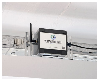
Récepteur de tension