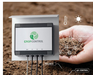
Smart Farming - système pour des mesures à long terme