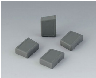
C8100188 Jeu de pieds de boîtier SEBS (TPE) volcan

Sous réserve de modifications techniques.