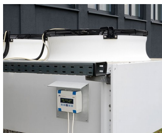
Commande de chauffage/climatisation/ventilation