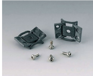
C8100360 Jeu de charnières