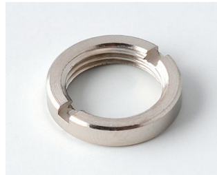
A6295009 Écrou rond 3/8"-32G

Sous réserve de modifications techniques. © OKW Gehäusesysteme, Buchen/Allemagne.