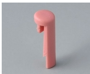
A1101003 Goupille PA 6 (UL 94 HB) corail