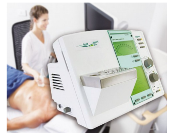
Élément de commande pour appareil de diagnostic