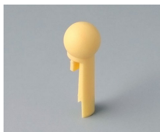
A1102004 À bout sphérique PA 6 (UL 94 HB) plage