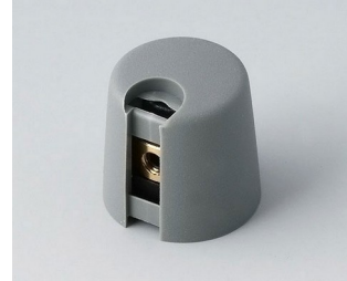
A1016068 TOP-KNOBS 16 PA 6 volcan 16x16mm 6mm