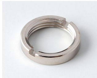
A6210009 Écrou rond M10 x 0,75