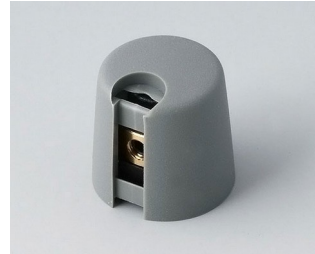
A1016068 TOP-KNOBS 16 PA 6 volcan 16x16mm 6mm