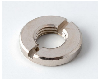
A6207009 Écrou rond M7 x 0,75