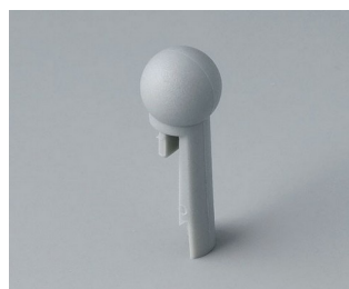
A1102007 À bout sphérique PA 6 (UL 94 HB) minéral