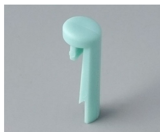
A1101005 Goupille PA 6 (UL 94 HB) lagon