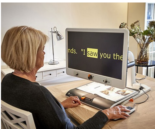
Boutons de commande pour téléagrandisseur