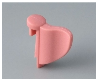
A1104003 En drapeau PA 6 (UL 94 HB) corail