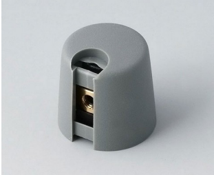
A1016048 TOP-KNOBS 16 PA 6 volcan 16x16mm 4mm