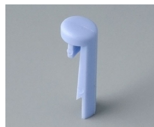
A1101006 Goupille PA 6 (UL 94 HB) ciel