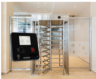
Terminal pour le contrôle d'accès