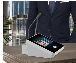
Microphone de table / interphone