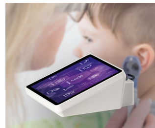
Appareil de test auditif