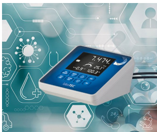
Appareil de mesure de laboratoire