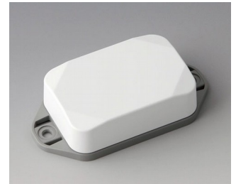
B1822226 MINI-DATA-BOX EF40, high, with flanges ASA+PC (UL 94 V-0) traffic white RAL 9016 60x40x20mm IP 65 opt., IP 40