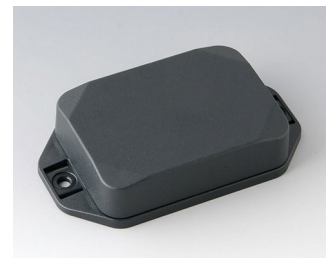
B1824228 MINI-DATA-BOX EF50, high, with flanges ASA+PC (UL 94 V-0) anthracite grey RAL 7016 70x50x20mm IP 65 opt., IP 40