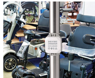
Data logger for Driving Operations