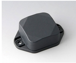
B1802228 MINI-DATA-BOX SF40, high, with flanges ASA+PC (UL 94 V-0) anthracite grey RAL 7016 40x40x20mm IP 65 opt., IP 40