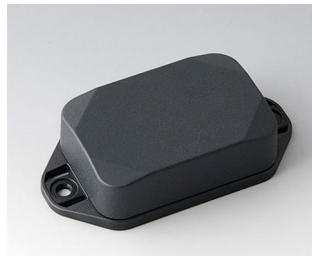
B1822228 MINI-DATA-BOX EF40, high, with flanges ASA+PC (UL 94 V-0) anthracite grey RAL 7016 60x40x20mm IP 65 opt., IP 40