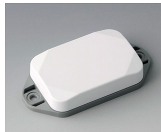
B1822126 MINI-DATA-BOX EF40, flat, with flanges ASA+PC (UL 94 V-0) traffic white RAL 9016 60x40x15mm IP 65 opt., IP 40