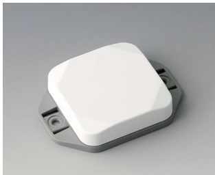
B1804126 MINI-DATA-BOX SF50, flat, with flanges ASA+PC (UL 94 V-0) traffic white RAL 9016 50x50x15mm IP 65 opt., IP 40