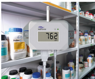
Gas detector for hazardous substances