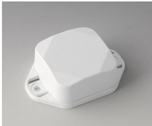
B1802227 MINI-DATA-BOX SF40, high, with flanges ASA+PC (UL 94 V-0) traffic white RAL 9016 40x40x20mm IP 65 opt., IP 40