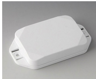
B1824127 MINI-DATA-BOX EF50, flat, with flanges ASA+PC (UL 94 V-0) traffic white RAL 9016 70x50x15mm IP 65 opt., IP 40