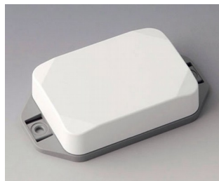
B1824226 MINI-DATA-BOX EF50, high, with flanges ASA+PC (UL 94 V-0) traffic white RAL 9016 70x50x20mm IP 65 opt., IP 40