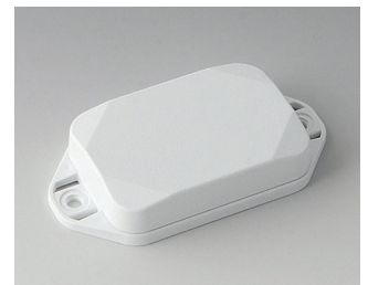
B1822127 MINI-DATA-BOX EF40, flat, with flanges ASA+PC (UL 94 V-0) traffic white RAL 9016 60x40x15mm IP 65 opt., IP 40