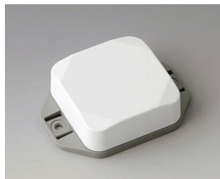
B1804226 MINI-DATA-BOX SF50, high, with flanges ASA+PC (UL 94 V-0) traffic white RAL 9016 50x50x20mm IP 65 opt., IP 40