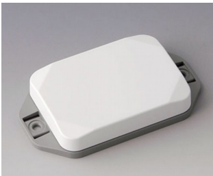
B1824126 MINI-DATA-BOX EF50, flat, with flanges ASA+PC (UL 94 V-0) traffic white RAL 9016 70x50x15mm IP 65 opt., IP 40