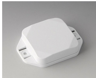
B1804127 MINI-DATA-BOX SF50, flat, with flanges ASA+PC (UL 94 V-0) traffic white RAL 9016 50x50x15mm IP 65 opt., IP 40