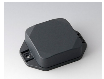
B1804228 MINI-DATA-BOX SF50, high, with flanges ASA+PC (UL 94 V-0) anthracite grey RAL 7016 50x50x20mm IP 65 opt., IP 40