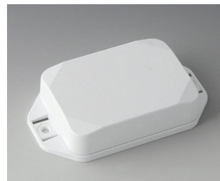
B1824227 MINI-DATA-BOX EF50, high, with flanges ASA+PC (UL 94 V-0) traffic white RAL 9016 70x50x20mm IP 65 opt., IP 40