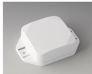
B1804227 MINI-DATA-BOX SF50, high, with flanges ASA+PC (UL 94 V-0) traffic white RAL 9016 50x50x20mm IP 65 opt., IP 40