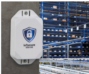
Access authorization of transponders