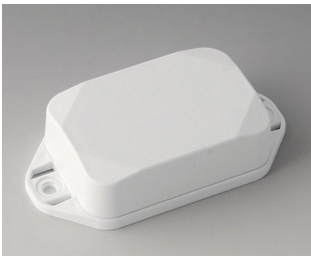
B1822227 MINI-DATA-BOX EF40, high, with flanges ASA+PC (UL 94 V-0) traffic white RAL 9016 60x40x20mm IP 65 opt., IP 40