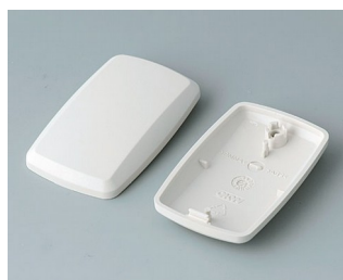
B9002857 Bottom and top part ES ABS (UL 94 HB) off-white RAL 9002 52x32x15mm