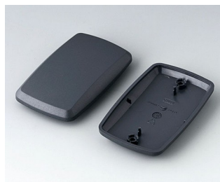
B9006858 Bottom and top part EL ABS (UL 94 HB) lava 78x48x20mm