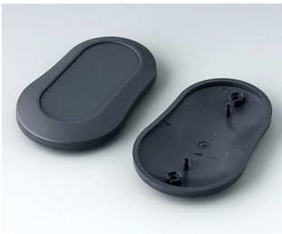
B9006908 Bottom and top part DL ABS (UL 94 HB) lava 84x53x19mm