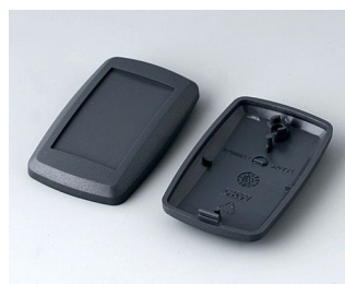
B9002808 Bottom and top part ES ABS (UL 94 HB) lava 52x32x15mm