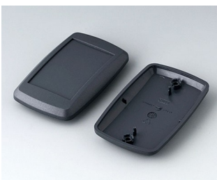
B9006808 Bottom and top part EL ABS (UL 94 HB) lava 78x48x20mm