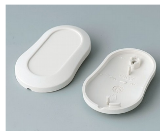
B9002907 Bottom and top part DS ABS (UL 94 HB) off-white RAL 9002 51x32x13mm