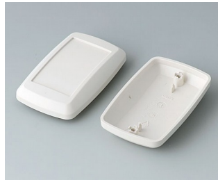
B9006827 Bottom and top part EL ABS (UL 94 HB) off-white RAL 9002 78x48x26mm