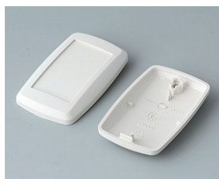
B9002807 Bottom and top part ES ABS (UL 94 HB) off-white RAL 9002 52x32x15mm