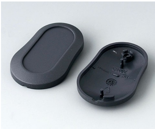
B9002908 Bottom and top part DS ABS (UL 94 HB) lava 51x32x13mm