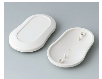
B9006907 Bottom and top part DL ABS (UL 94 HB) off-white RAL 9002 84x53x19mm