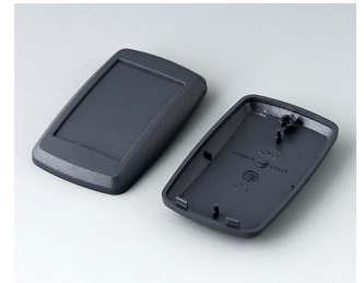
B9004808 Bottom and top part EM ABS (UL 94 HB) lava 68x42x18mm