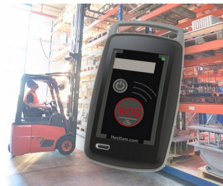
Mobile Security Solutions for workers