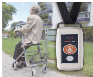
Radio transmitter for emergency call system for patients