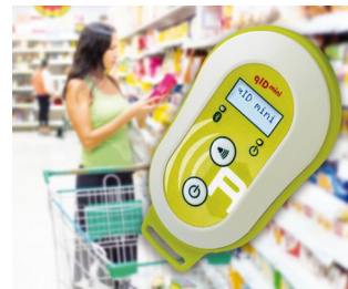
Mobile UHF RFID scanner