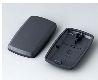
B9002858 Bottom and top part ES ABS (UL 94 HB) lava 52x32x15mm