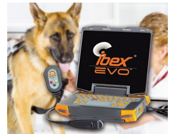
Portable ultrasonic device for veterinary medicine