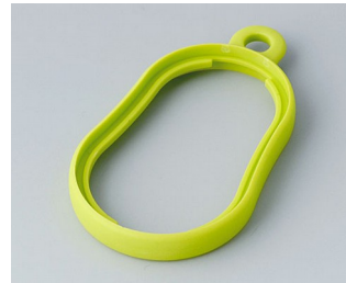
B9002354 Intermediate ring DS TPE green