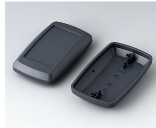
B9006828 Bottom and top part EL ABS (UL 94 HB) lava 78x48x26mm