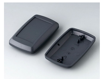
B9006818 Bottom and top part EL ABS (UL 94 HB) lava 78x48x24mm