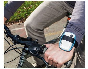
Mobile air quality monitoring