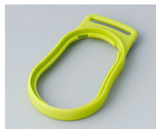
B9002304 Intermediate ring DS SEBS (TPE) green