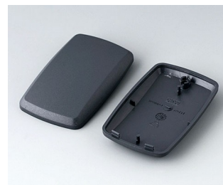
B9004858 Bottom and top part EM ABS (UL 94 HB) lava 68x42x18mm