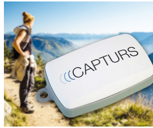
GPS tracking in real time