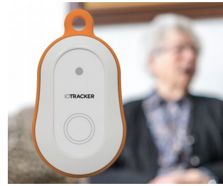
LoRa GPS tracker with alarm button