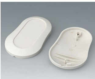
B9004907 Bottom and top part DM ABS (UL 94 HB) off-white RAL 9002 70x44x16mm