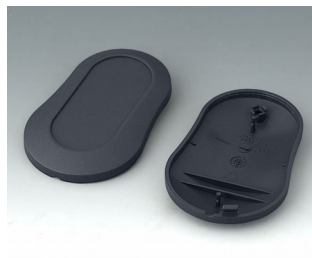
B9004908 Bottom and top part DM ABS (UL 94 HB) lava 70x44x16mm