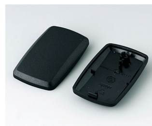
B9002856 Bottom and top part ES PMMA (IR) (UL 94 HB) black RAL 9005 52x32x15mm