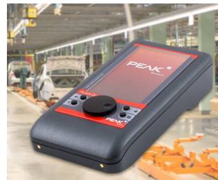
Mobile diagnostic device for CAN and CAN FD buses