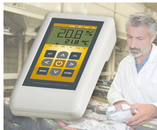
Misuratore di ossigeno in aria