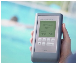
Electronic pool tester