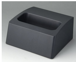
A9107508 Station L ASA+PC (UL 94 V-0) lava