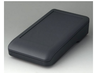
A9007118 DATEC-COMPACT L ASA+PC (UL 94 V-0) lava 206x110x47mm IP 41