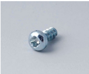
A0305031 Self-tapping screws 2.5 x 6 mm (PZ1)