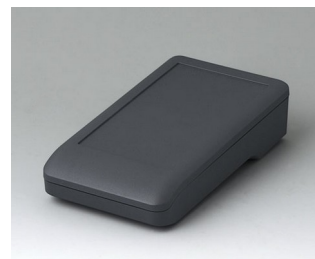
A9005118 DATEC-COMPACT S ASA+PC (UL 94 V-0) lava 136x74x32mm IP 41