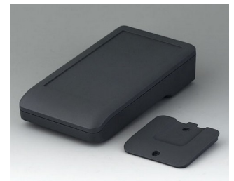
A9006218 DATEC-COMPACT M ASA+PC (UL 94 V-0) lava 172x92x39mm IP 41