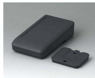
A9005218 DATEC-COMPACT S ASA+PC (UL 94 V-0) lava 136x74x32mm IP 41