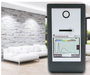
Spectral light meter