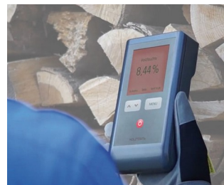
Wood moisture measuring device