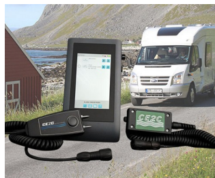
System for leak detection in leisure vehicles