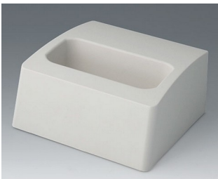
A9107507 Station L ASA+PC (UL 94 V-0) off-white RAL 9002