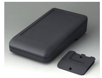
A9007218 DATEC-COMPACT L ASA+PC (UL 94 V-0) lava 206x110x47mm IP 41