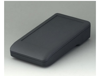
A9006118 DATEC-COMPACT M ASA+PC (UL 94 V-0) lava 172x92x39mm IP 41