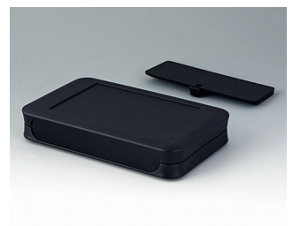
A9053219 SOFT-CASE XL PMMA (IR) (UL 94 HB) black RAL 9005 92x150x28mm IP 40