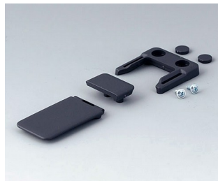
A9152048 Combi-Clip ABS (UL 94 HB) lava 45x27mm