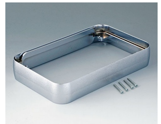
A9153011 Intermediate ring XL ABS (UL 94 HB) matt chromed 96x154x26mm