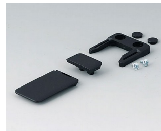
A9152049 Combi-Clip ABS (UL 94 HB) black RAL 9005 45x27mm