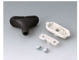
B2911329 Cable gland kit, 5.0 - 5.9 TPE black RAL 9005