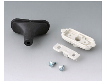
B2911309 Cable gland kit, 3.4 - 4.2 TPE black RAL 9005