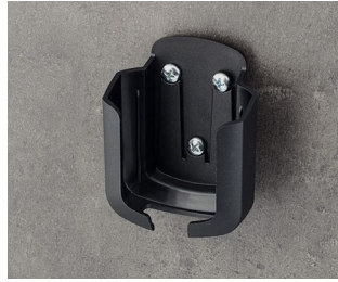
B2931509 Holder M ASA+PC (UL 94 V-0) black RAL 9005