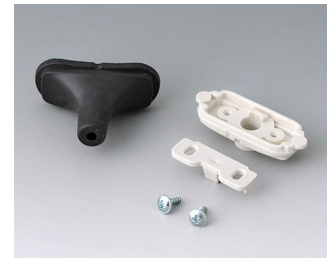
B2911309 Cable gland kit, 3.4 - 4.2 TPE black RAL 9005