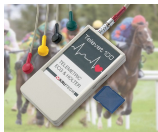
Telemetric ECG system for veterinary medicine