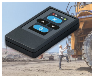
Radio transmitter for machines