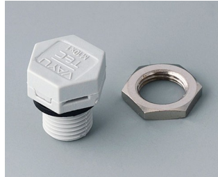
C2310917 Pressure equalisation element M10x1 PA 6 (UL 94 HB) light grey RAL 7035 IP 56