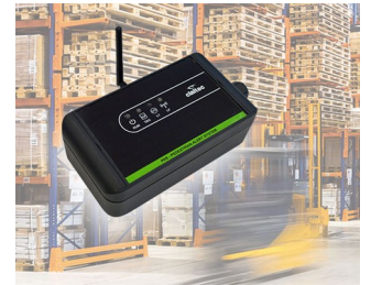
Pedestrian Alert System