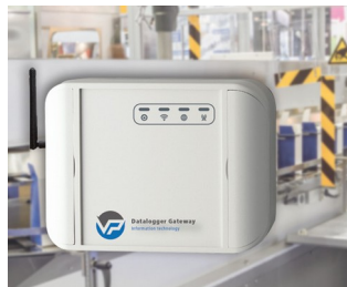
Data logger for machine monitoring