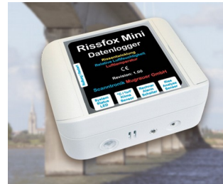
Miniature data logger for crack displacements and climatic data