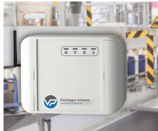
Data logger for machine monitoring