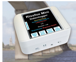
Miniature data logger for crack displacements and climatic data