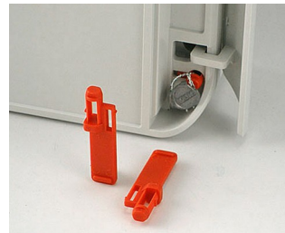
C6100016 Set of security PA 6 red