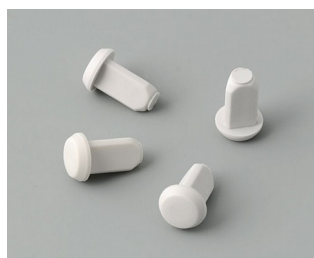
C2299018 Case feet TPE (UL 94 HB)