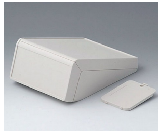
B4056217 UNITEC M, 1.4/1.4 ABS (UL 94 HB) off-white RAL 9002 148x210x80mm IP 40