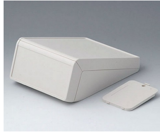
B4056217 UNITEC M, 1.4/1.4 ABS (UL 94 HB) off-white RAL 9002 148x210x80mm IP 40