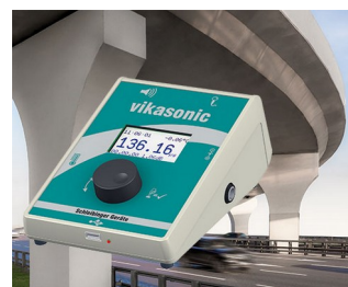
Ultrasonic measuring device