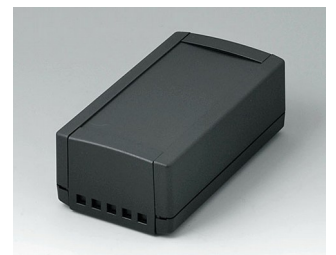
B1060469 TOPTEC 154 H, Vers. II ABS (UL 94 HB) black RAL 9005 154x84x56mm IP 40