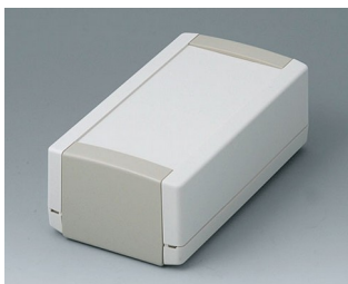
B1060365 TOPTEC 154 H, Vers. I ABS (UL 94 HB) off-white RAL 9002 154x84x56mm IP 40