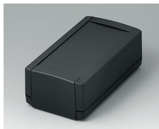
B1060369 TOPTEC 154 H, Vers. I ABS (UL 94 HB) black RAL 9005 154x84x56mm IP 40