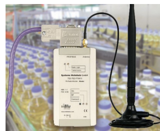
PROFIBUS radio system