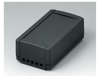
B1050469 TOPTEC 123 H, Vers. II ABS (UL 94 HB) black RAL 9005 123x68x45mm IP 40