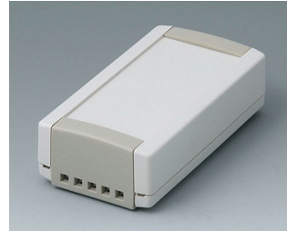
B1040465 TOPTEC 102, Vers. II ABS (UL 94 HB) off-white RAL 9002 102x54x30mm IP 40