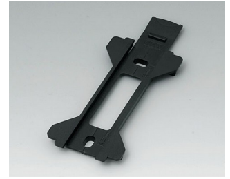
B1360029 Wall suspension element for Toptec 154 ABS (UL 94 HB) black RAL 9005