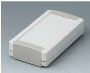
B1055365 TOPTEC 123 F, Vers. I ABS (UL 94 HB) off-white RAL 9002 123x68x30mm IP 40