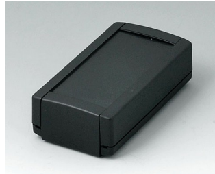
B1040369 TOPTEC 102, Vers. I ABS (UL 94 HB) black RAL 9005 102x54x30mm IP 40