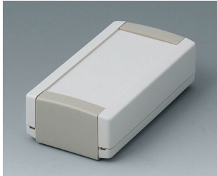
B1040365 TOPTEC 102, Vers. I ABS (UL 94 HB) off-white RAL 9002 102x54x30mm IP 40