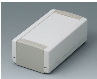
B1050365 TOPTEC 123 H, Vers. I ABS (UL 94 HB) off-white RAL 9002 123x68x45mm IP 40