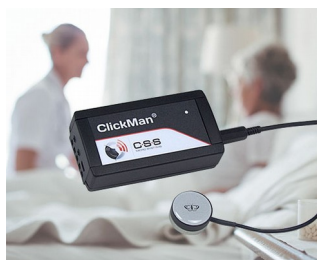
Adaptive multicontroller for single sensors