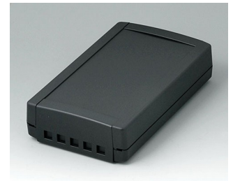
B1075469 TOPTEC 194 F, Vers. II ABS (UL 94 HB) black RAL 9005 194x115x46mm IP 40