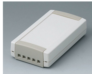
B1055465 TOPTEC 123 F, Vers. II ABS (UL 94 HB) off-white RAL 9002 123x68x30mm IP 40