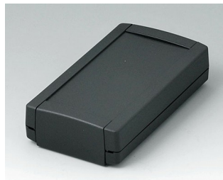
B1055369 TOPTEC 123 F, Vers. I ABS (UL 94 HB) black RAL 9005 123x68x30mm IP 40