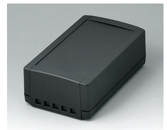
B1070469 TOPTEC 194 H, Vers. II ABS (UL 94 HB) black RAL 9005 194x115x68mm IP 40