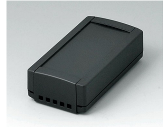
B1040469 TOPTEC 102, Vers. II ABS (UL 94 HB) black RAL 9005 102x54x30mm IP 40