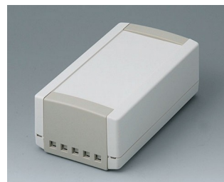
B1060465 TOPTEC 154 H, Vers. II ABS (UL 94 HB) off-white RAL 9002 154x84x56mm IP 40