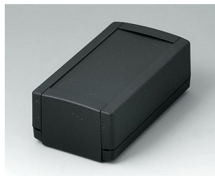
B1050369 TOPTEC 123 H, Vers. I ABS (UL 94 HB) black RAL 9005 123x68x45mm IP 40