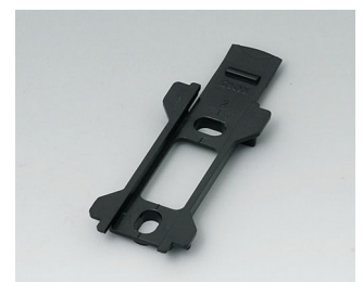
B1340029 Wall suspension element for Topotec 102 ABS (UL 94 HB) black RAL 9005