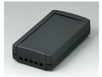
B1055469 TOPTEC 123 F, Vers. II ABS (UL 94 HB) black RAL 9005 123x68x30mm IP 40