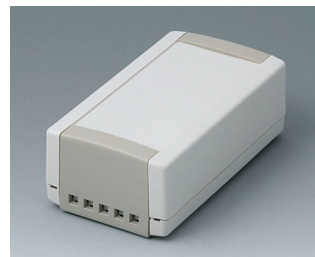
B1050465 TOPTEC 123 H, Vers. II ABS (UL 94 HB) off-white RAL 9002 123x68x45mm IP 40