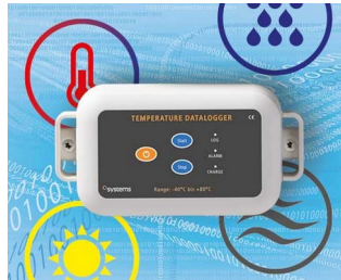
Data logger e.g. for temperature