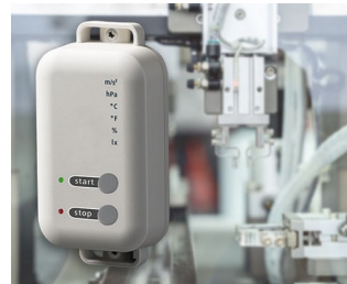
Data logger with gateway function