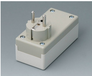
A9011665 PLUG CASE F / D, Vers. I PC+ABS (UL 94 V-0) off-white RAL 9002 100x50x40mm