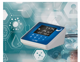
Laboratory measuring device