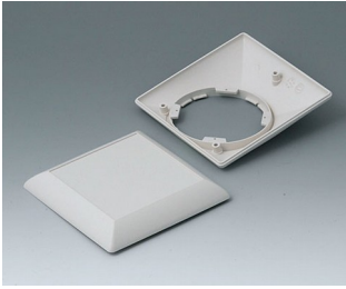
B5012207 Bottom and top part S110F ABS (UL 94 HB) off-white RAL 9002 110x110x38mm