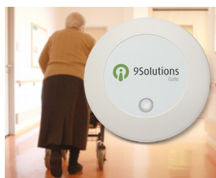
Access management in care facilities