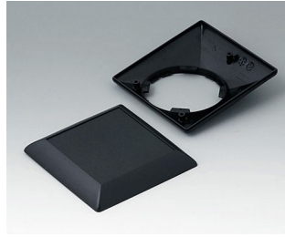
B5012209 Bottom and top part S110 F ABS (UL 94 HB) black RAL 9005 110x110x38mm