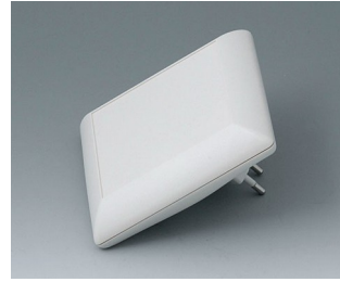
B5013227 ART-CASE S110 F PC+ABS (UL 94 V-0) off-white RAL 9002 110x110x38mm IP 40