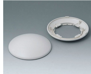
B5010107 Bottom and top part R110 H ABS (UL 94 HB) off-white RAL 9002 ø110x38mm