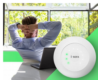
CO2 sensor traffic light