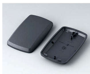
B9004858 Bottom and top part EM ABS (UL 94 HB) lava 68x42x18mm