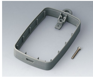
B9004778 Intermediate ring EM, Micro USB 5 P, B Type SMT SEBS (TPE) volcano