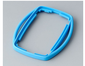
B9002755 Intermediate ring ES TPE blue