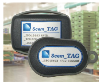
RFID sensor transponder and data logger