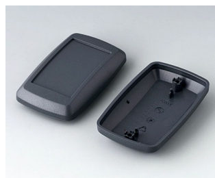
B9006828 Bottom and top part EL ABS (UL 94 HB) lava 78x48x26mm