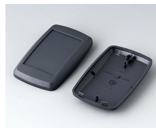
B9004808 Bottom and top part EM ABS (UL 94 HB) lava 68x42x18mm