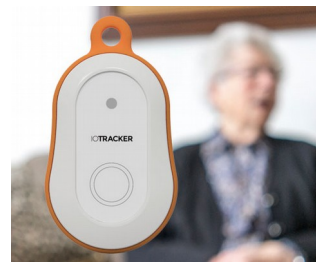
LoRa GPS tracker with alarm button