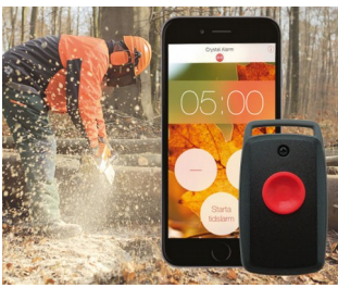
A personal alarm on your mobile phone