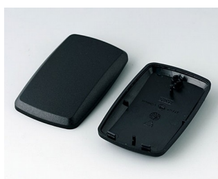
B9004856 Bottom and top part EM PMMA (IR) (UL 94 HB) black RAL 9005 68x42x18mm