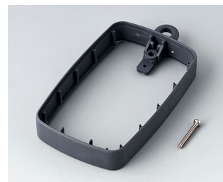
B9004782 Intermediate ring EM, high SEBS (TPE) lava