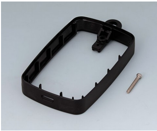
B9004776 Intermediate ring EM, Micro USB 5 P, B Type SMT PMMA (IR) (UL 94 HB) black RAL 9005