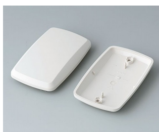
B9006857 Bottom and top part EL ABS (UL 94 HB) off-white RAL 9002 78x48x20mm