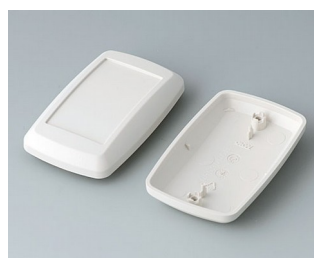
B9006817 Bottom and top part EL ABS (UL 94 HB) off-white RAL 9002 78x48x24mm