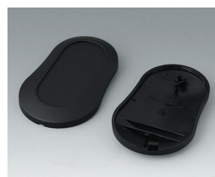
B9004906 Bottom and top part DM PMMA (IR) (UL 94 HB) black RAL 9005 70x44x16mm