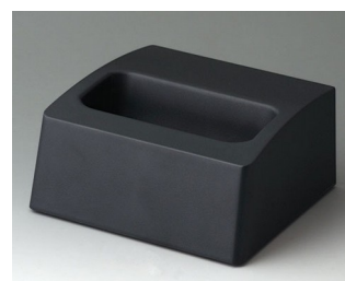
A910658 Station M ASA+PC (UL 94 V-0) lava