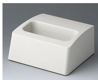
A910657 Station M ASA+PC (UL 94 V-0) off-white RAL 9002