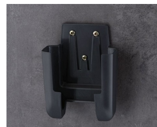
A9106628 Holder M ASA+PC (UL 94 V-0) lava