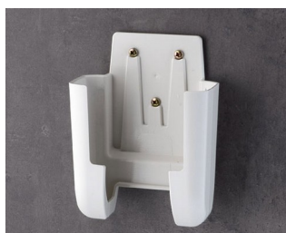
A9107627 Holder L ASA+PC (UL 94 V-0) off-white RAL 9002