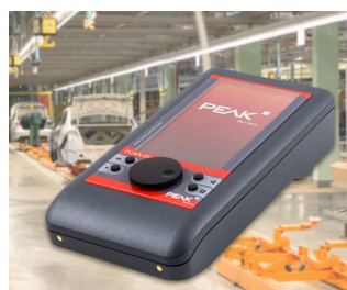
Mobile diagnostic device for CAN and CAN FD buses