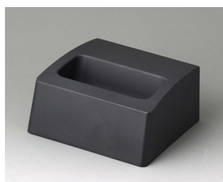
A910558 Station S ASA+PC (UL 94 V-0) lava