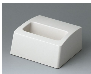
A910557 Station S ASA+PC (UL 94 V-0) off-white RAL 9002