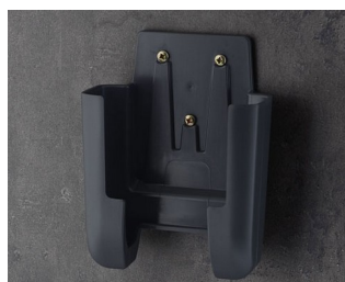
A9107628 Holder L ASA+PC (UL 94 V-0) lava