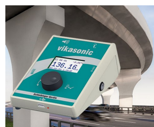
Ultrasonic measuring device