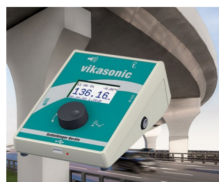
Ultrasonic measuring device