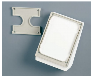
B4156307 Wall suspension element M off-white RAL 9002