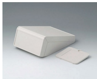
B4054327 UNITEC S, 1.4/0.6 ABS (UL 94 HB) off-white RAL 9002 125x177x69mm IP 40