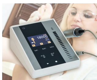
Foot care device