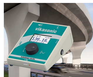
Ultrasonic measuring device