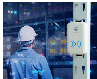
Smart store logistics