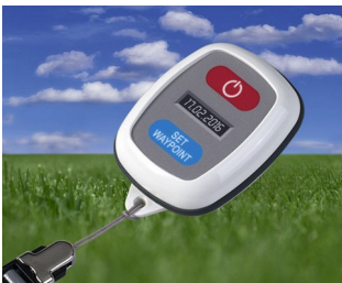
GPS tracking system