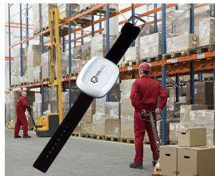
Overcrowd prevention and Safe distancing