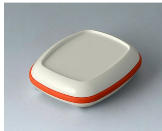
B1604207 BODY-CASE M, with recess ASA (UL 94 HB) traffic white RAL 9016 50x41x14mm IP 65