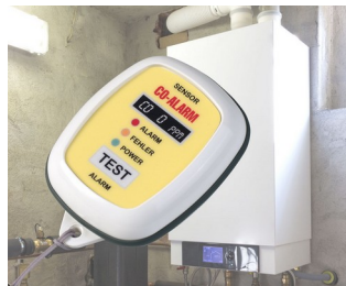
CO gas alert