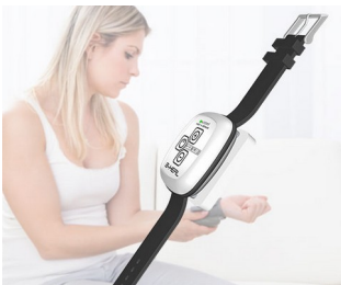
B-heal Hybrid Blood Zapper