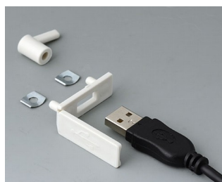
A9320107 USB cover PP off-white RAL 9002 35x13mm