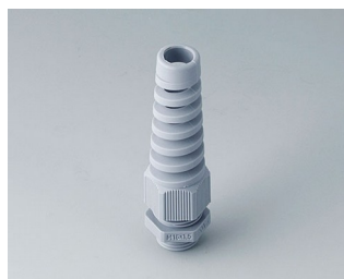
C2316518 Cable gland M16x1.5, bending protection PA silver grey RAL 7001