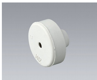
C2312137 Cable grommet EPDM light grey RAL 7035