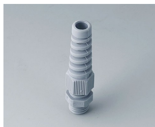
C2312518 Cable gland M12x1.5, bending protection PA silver grey RAL 7001