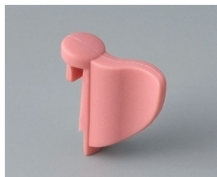
A1104003 Wing PA 6 (UL 94 HB) coral