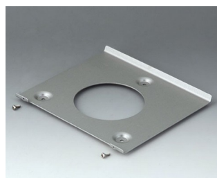
B4522101 Wall suspension element 220 Aluminium