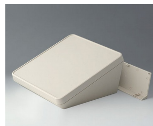
B4422207 PROTEC 220, Vers. II ASA+PC (UL 94 V-0) off-white RAL 9002 220x220x108mm IP 65 opt.