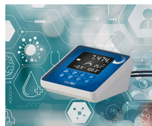
Laboratory measuring device