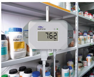
Gas detector for hazardous substances