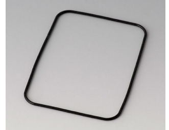
B1924101 Sealing E50/EF50

Sujeito à modificações técnicas sem aviso prévio.