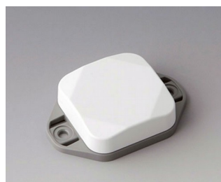
B1802126 MINI-DATA-BOX SF40, flat, with flanges ASA+PC (UL 94 V-0) traffic white RAL 9016 40x40x15mm IP 65 opt., IP 40