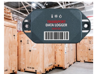
Data logger in transportation