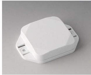
B1804127 MINI-DATA-BOX SF50, flat, with flanges ASA+PC (UL 94 V-0) traffic white RAL 9016 50x50x15mm IP 65 opt., IP 40