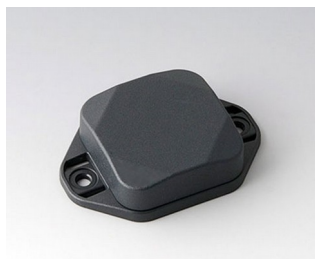
B1802128 MINI-DATA-BOX SF40, flat, with flanges ASA+PC (UL 94 V-0) anthracite grey RAL 7016 40x40x15mm IP 65 opt., IP 40