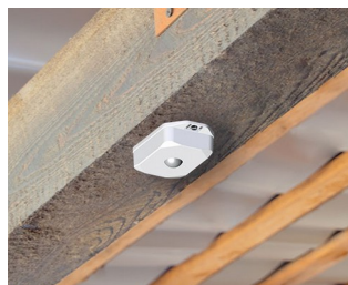
Motion detector with sensor for automatic control