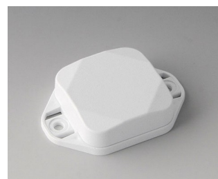
B1802127 MINI-DATA-BOX SF40, flat, with flanges ASA+PC (UL 94 V-0) traffic white RAL 9016 40x40x15mm IP 65 opt., IP 40