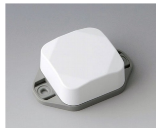
B1802226 MINI-DATA-BOX SF40, high, with flanges ASA+PC (UL 94 V-0) traffic white RAL 9016 40x40x20mm IP 65 opt., IP 40