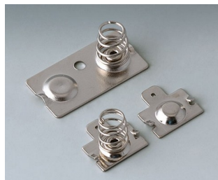
B2904210 Set of battery clips Steel nickel-plated