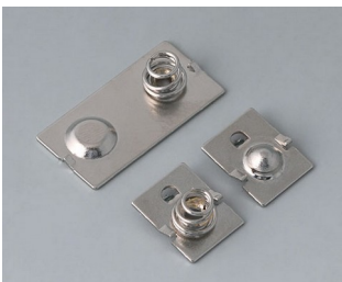
A9190020 Set of battery clips Steel nickel-plated