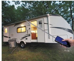
Mobile gas detector