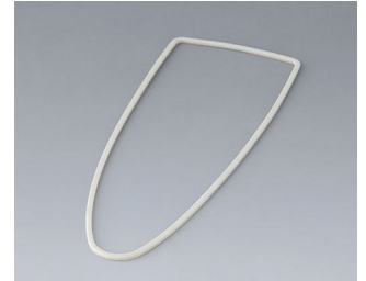
B2904011 Sealing L TPV 50A