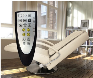
Control unit for Relax and Massage Chairs