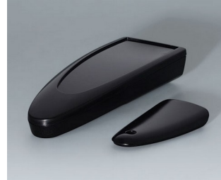
B2803016 STYLE-CASE M PMMA (IR) (UL 94 HB) black RAL 9005 147x56x27mm IP 65 opt., IP 40