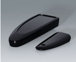
B2802016 STYLE-CASE S PMMA (IR) (UL 94 HB) black RAL 9005 123x48x24mm IP 40