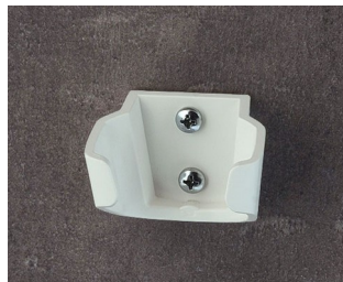
B2902037 Holder S ASA (UL 94 HB) traffic white RAL 9016