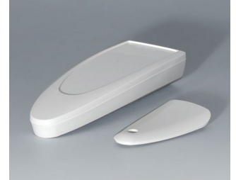
B2803017 STYLE-CASE M ASA (UL 94 HB) traffic white RAL 9016 147x56x27mm IP 65 opt., IP 40