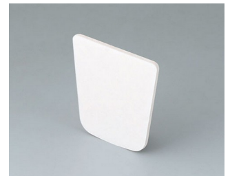
B2903031 Adhesive foil M