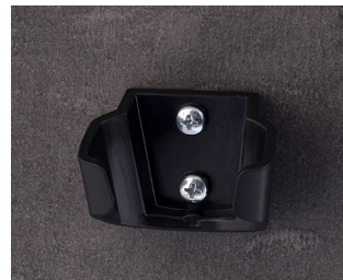
B2902039 Holder S ASA (UL 94 HB) black RAL 9005