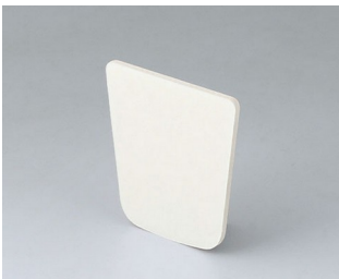
B2902031 Adhesive foil S