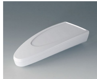
B2804027 STYLE-CASE L ASA (UL 94 HB) traffic white RAL 9016 166x64x31mm IP 65 opt., IP 40