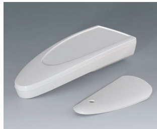
B2804017 STYLE-CASE L ASA (UL 94 HB) traffic white RAL 9016 166x64x31mm IP 65 opt., IP 40