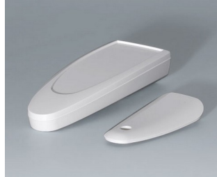
B2802017 STYLE-CASE S ASA (UL 94 HB) traffic white RAL 9016 123x48x24mm IP 40