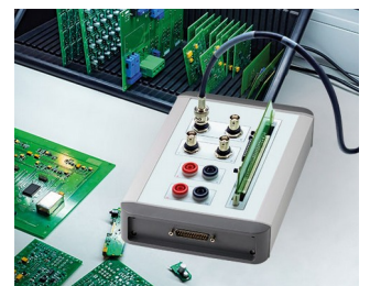
Testing of electronic components