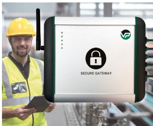
Industrial Secure Gateway