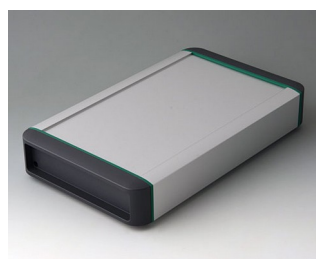
B3407031 SMART-TERMINAL 240 Aluminium AlMgSi 0,5 matt anodised 282x170x50mm IP 54