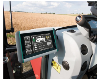
ISOBUS terminal for tractors and self-propelled machines