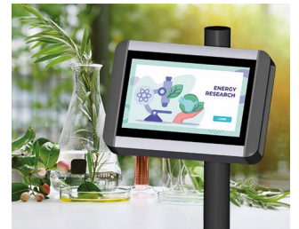
Plant research terminal