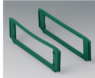
B3507016 Designer seals set, green TPV 50A green