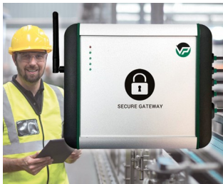
Industrial Secure Gateway