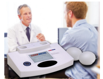
Multiple analytical resonance system