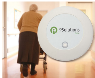
Access management in care facilities