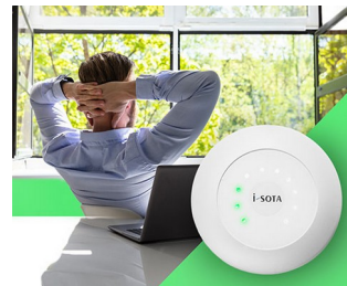
CO2 sensor traffic light