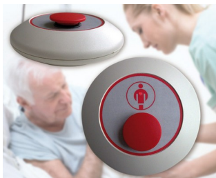
Radio paging mushroom-type button