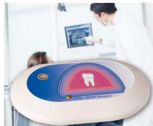
RFID Reader for the CTV system