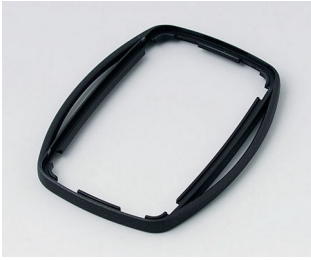
B9004756 Intermediate ring EM PMMA (IR) (UL 94 HB) black RAL 9005