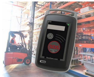
Mobile Security Solutions for workers