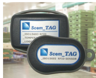
RFID sensor transponder and data logger