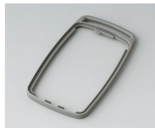
B9004708 Intermediate ring EM TPE volcano