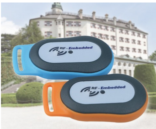
Mobile RFID information system