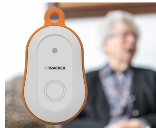
LoRa GPS tracker with alarm button