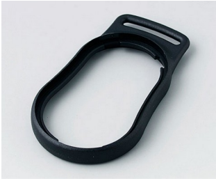
B9002306 Intermediate ring DS PMMA (IR) (UL 94 HB) black RAL 9005