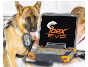
Portable ultrasonic device for veterinary medicine