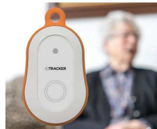
LoRa GPS tracker with alarm button