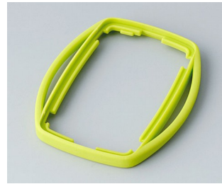
B9002754 Intermediate ring ES TPE green