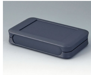
A9052108 SOFT-CASE L ABS (UL 94 HB) lava 73x117x24mm IP 54 opt., IP 40