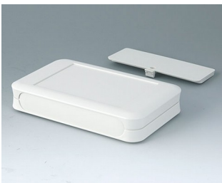
A9053117 SOFT-CASE XL ABS (UL 94 HB) off-white RAL 9002 92x150x28mm IP 40