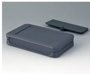
A9053118 SOFT-CASE XL ABS (UL 94 HB) lava 92x150x28mm IP 40