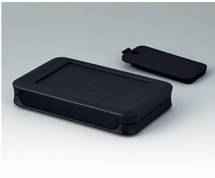
A9051219 SOFT-CASE M PMMA (IR) (UL 94 HB) black RAL 9005 65x105x19mm IP 40