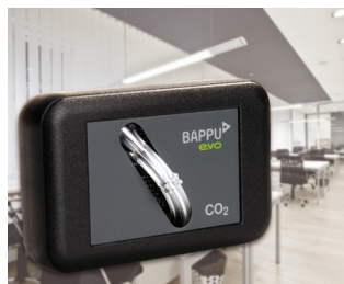
Sensor for measuring carbon dioxide concentration