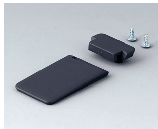
A9152058 Tilt foot bar ABS (UL 94 HB) lava