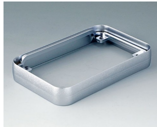
A9151011 Intermediate ring M ABS (UL 94 HB) matt chromed 68x108x16mm