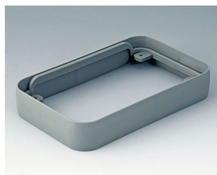
A9152118 Intermediate protection ring L SEBS (TPE) volcano 76x120x21mm