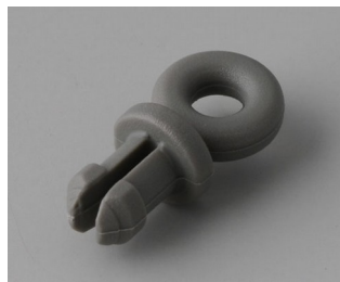
A9100002 Ring eyelet PA 6 volcano