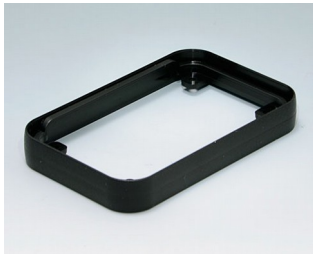
A9150219 Intermediate ring S PMMA (IR) (UL 94 HB) black RAL 9005 54x85x12mm