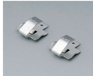
A9174006 Set of battery clips, 1 x 9 V Steel tin-plated