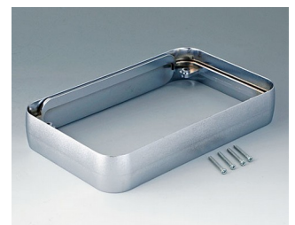
A9153011 Intermediate ring XL ABS (UL 94 HB) matt chromed 96x154x26mm