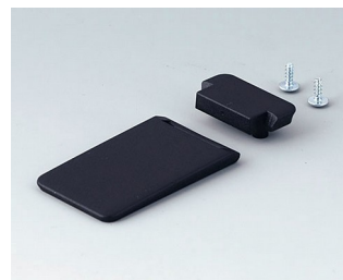
A9152059 Tilt foot bar ABS (UL 94 HB) black RAL 9005

Sujeito à modificações técnicas sem aviso prévio. © de OKW Gehäusesysteme, Buchen/Alemanha.