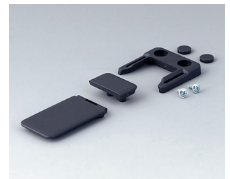
A9152048 Combi-Clip ABS (UL 94 HB) lava 45x27mm