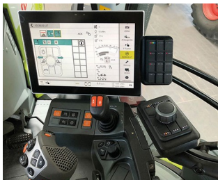
Digital joystick for ISO bus machines