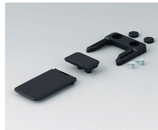
A9152049 Combi-Clip ABS (UL 94 HB) black RAL 9005 45x27mm