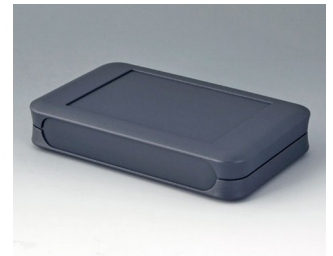
A9053108 SOFT-CASE XL ABS (UL 94 HB) lava 92x150x28mm IP 40