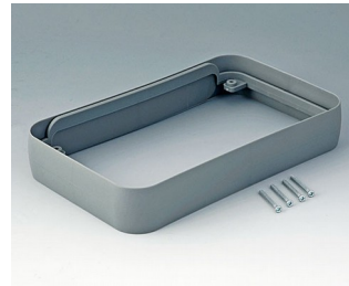
A9153118 Intermediate ring XL SEBS (TPE) volcano 96x154x26mm