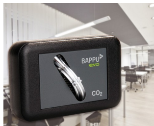
Sensor for measuring carbon dioxide concentration