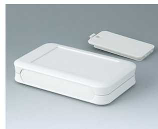
A9052117 SOFT-CASE L ABS (UL 94 HB) off-white RAL 9002 73x117x24mm IP 40