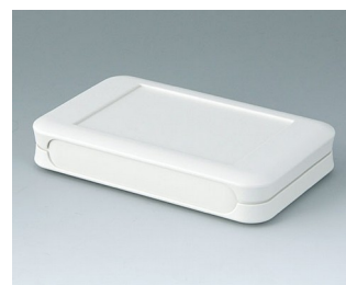
A9051107 SOFT-CASE M ABS (UL 94 HB) off-white RAL 9002 65x105x19mm IP 54 opt., IP 40