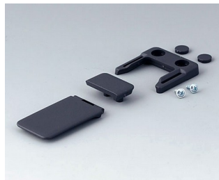
A9152048 Combi-Clip ABS (UL 94 HB) lava 45x27mm