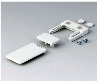
A9152047 Combi-Clip ABS (UL 94 HB) off-white RAL 9002 45x27mm