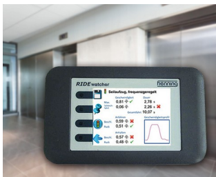
RIDEwatcher Multimeter for ride profiles