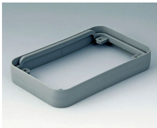
A9151118 Intermediate protection ring M SEBS (TPE) volcano 68x108x16mm