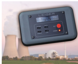
Geiger counter with logging function