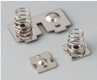
A9151010 Set of battery clips, 2 x AAA Steel nickel-plated