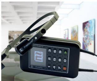
Multimedia audioguide for museums