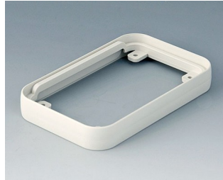
A9150017 Intermediate ring S ABS (UL 94 HB) off-white RAL 9002 54x85x12mm