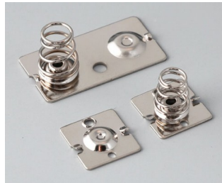
A9152010 Set of battery clips, 2/4 x AA Steel nickel-plated