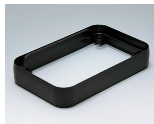
A9152219 Intermediate ring L PMMA (IR) (UL 94 HB) black RAL 9005 76x120x21mm