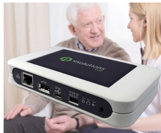
Real-time localisation in the healthcare sector