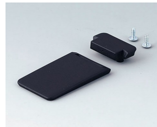
A9152059 Tilt foot bar ABS (UL 94 HB) black RAL 9005

Sujeito à modificações técnicas sem aviso prévio. © de OKW Gehäusesysteme, Buchen/Alemanha.