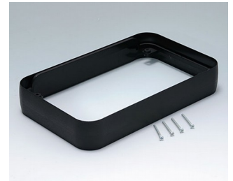
A9153219 Intermediate ring XL PMMA (IR) (UL 94 HB) black RAL 9005 96x154x26mm