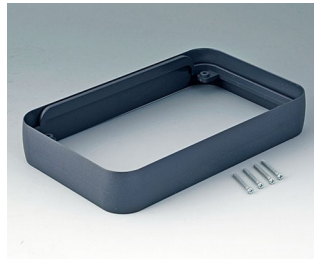
A9153018 Intermediate ring XL ABS (UL 94 HB) lava 96x154x26mm