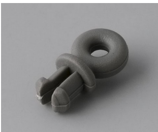
A9100001 Ring eyelet PA 6 volcano