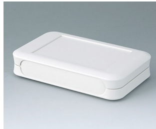
A9052107 SOFT-CASE L ABS (UL 94 HB) off-white RAL 9002 73x117x24mm IP 54 opt., IP 40