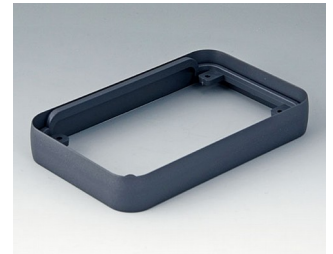
A9151018 Intermediate ring M ABS (UL 94 HB) lava 68x108x16mm