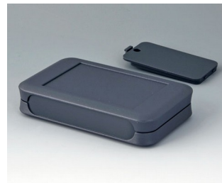
A9052128 SOFT-CASE L ABS (UL 94 HB) lava 73x117x24mm IP 40