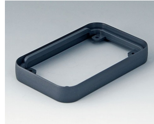
A9150018 Intermediate ring S ABS (UL 94 HB) lava 54x85x12mm