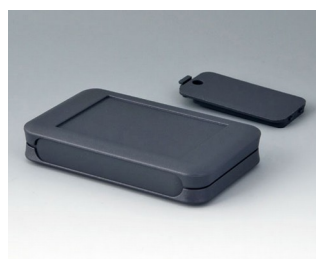
A9051118 SOFT-CASE M ABS (UL 94 HB) lava 65x105x19mm IP 40