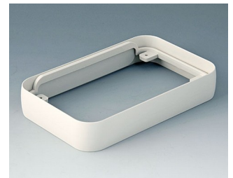
A9152017 Intermediate ring L ABS (UL 94 HB) off-white RAL 9002 76x120x21mm