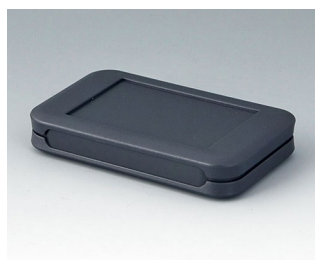
A9050108 SOFT-CASE S ABS (UL 94 HB) lava 51x82x14mm IP 54 opt., IP 40