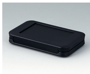
A9050209 SOFT-CASE S PMMA (IR) (UL 94 HB) black RAL 9005 51x82x14mm IP 54 opt., IP 40