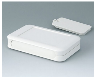
A9052127 SOFT-CASE L ABS (UL 94 HB) off-white RAL 9002 73x117x24mm IP 40