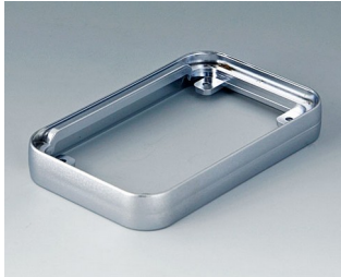
A9150011 Intermediate ring S ABS (UL 94 HB) matt chromed 54x85x12mm