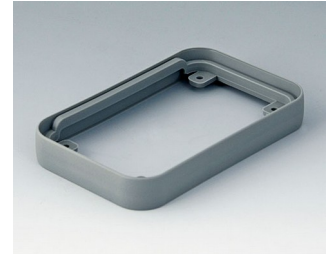
A9150118 Intermediate protection ring S SEBS (TPE) volcano 54x85x12mm