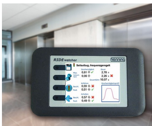
RIDEwatcher Multimeter for ride profiles