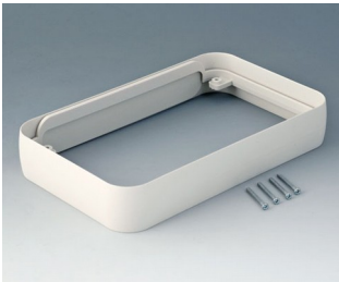
A9153017 Intermediate ring XL ABS (UL 94 HB) off-white RAL 9002 96x154x26mm