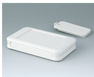
A9051117 SOFT-CASE M ABS (UL 94 HB) off-white RAL 9002 65x105x19mm IP 40