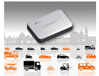
Module for smart mobility applications