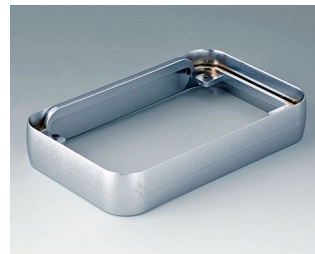
A9152011 Intermediate ring L ABS (UL 94 HB) matt chromed 76x120x21mm