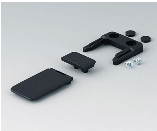
A9152049 Combi-Clip ABS (UL 94 HB) black RAL 9005 45x27mm