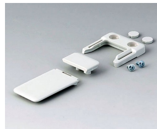
A9152047 Combi-Clip ABS (UL 94 HB) off-white RAL 9002 45x27mm