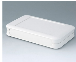
A9053107 SOFT-CASE XL ABS (UL 94 HB) off-white RAL 9002 92x150x28mm IP 40