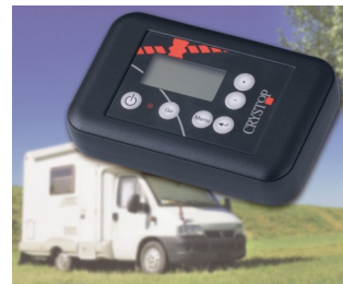
Remote control unit for AutoSat satellite receiver