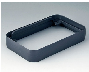
A9152018 Intermediate ring L ABS (UL 94 HB) lava 76x120x21mm