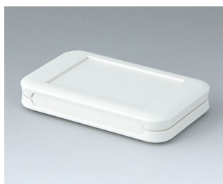
A9050107 SOFT-CASE S ABS (UL 94 HB) off-white RAL 9002 51x82x14mm IP 54 opt., IP 40