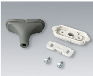
B2911318 Cable gland kit, 4.2 - 5.0 TPE volcano