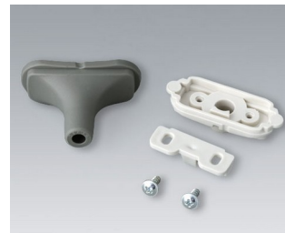
B2911328 Cable gland kit, 5.0 - 5.9 TPE volcano