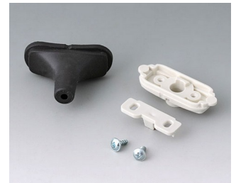
B2911309 Cable gland kit, 3.4 - 4.2 TPE black RAL 9005