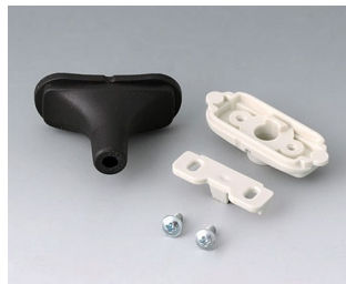
B2911319 Cable gland kit, 4.2 - 5.0 TPE black RAL 9005