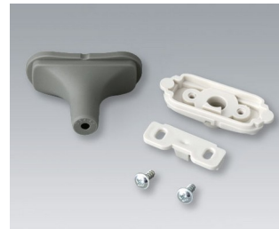
B2911308 Cable gland kit, 3.4 - 4.2 TPE volcano