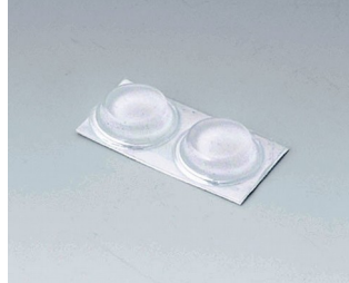
A9212330 Anti-slide feet 12 x 3.5 mm transparent

Sujeito à modificações técnicas sem aviso prévio. © de OKW Gehäusesysteme, Buchen/Alemanha.