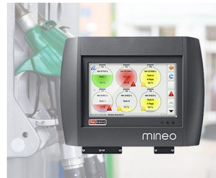
Controller for intelligent tank management