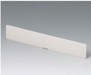
A9194007 Slot-in panel ABS (UL 94 HB) off-white RAL 9002 156x30x3mm