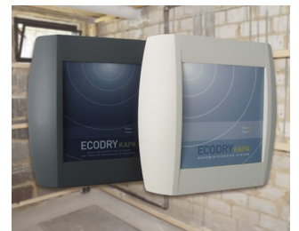
Systems for drying brickwork