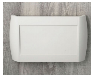
A9095107 DIATEC L ABS (UL 94 HB) off-white RAL 9002 330x48x200mm IP 40