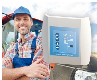
Weather Monitoring Station