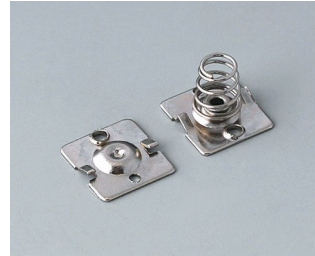
A9190015 Set of battery clips, 2 x AA Steel nickel-plated