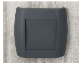
A9093108 DIATEC S ABS (UL 94 HB) lava 210x48x200mm IP 40