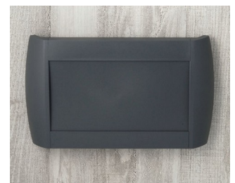
A9095108 DIATEC L ABS (UL 94 HB) lava 330x48x200mm IP 40