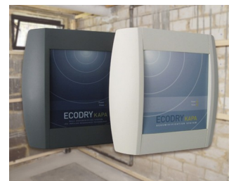
Systems for drying brickwork