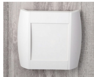
A9093107 DIATEC S ABS (UL 94 HB) off-white RAL 9002 210x48x200mm IP 40