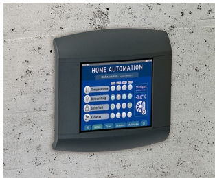
Control panel for home automation