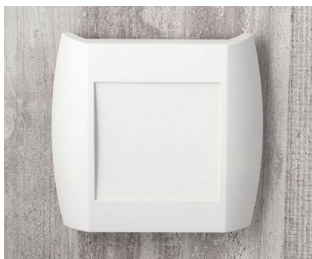
A9092107 DIATEC XS ABS (UL 94 HB) off-white RAL 9002 150x37x155mm IP 40