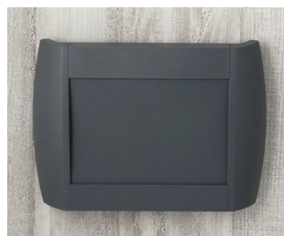
A9094108 DIATEC M ABS (UL 94 HB) lava 270x48x200mm IP 40