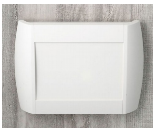
A9094107 DIATEC M ABS (UL 94 HB) off-white RAL 9002 270x48x200mm IP 40