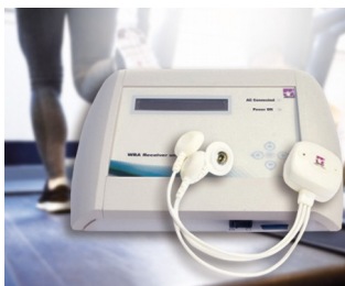
WBA receiver unit for measuring biosignals