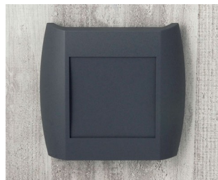
A9092108 DIATEC XS ABS (UL 94 HB) lava 150x37x155mm IP 40