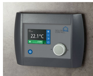
Solar Control Panel