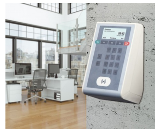
Time recording terminal