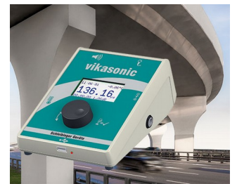
Ultrasonic measuring device