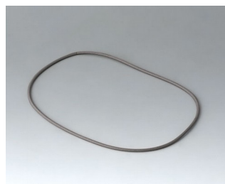
A9503030 Sealing 125