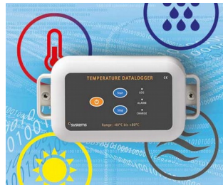
Data logger e.g. for temperature