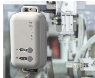
Data logger with gateway function