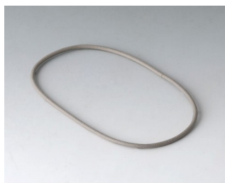
A9500030 Sealing 80