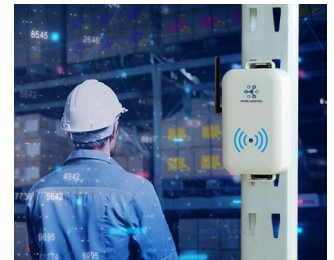
Smart store logistics