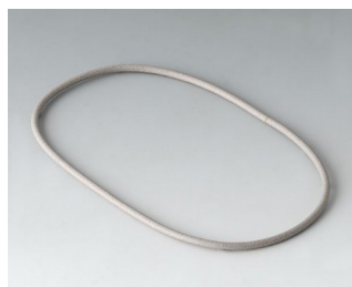
A9502030 Sealing 100