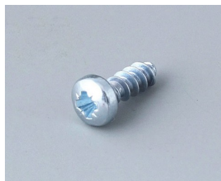
A0308031 Self-tapping screws 3 x 8 mm (PZ1)