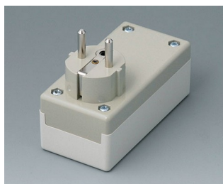
A9011665 PLUG CASE F / D, Vers. I PC+ABS (UL 94 V-0) off-white RAL 9002 100x50x40mm