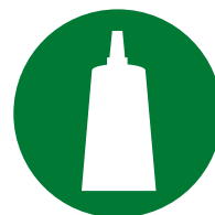
Instalação / Montagem de acessórios