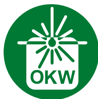
Letragem a laser