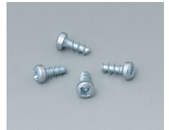
A9199008 Set of screws