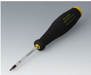
A0399T06 Torx T6 screwdriver