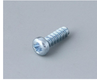
A0325080 Self-tapping screws 2.5 x 8 mm (PZ1)