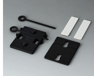
A9305019 Wall suspension elements ASA+PC (UL 94 V-0) black RAL 9005