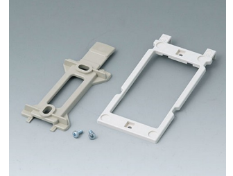
B1350048 Wall suspension elements ABS (UL 94 HB) pebble grey RAL 7032