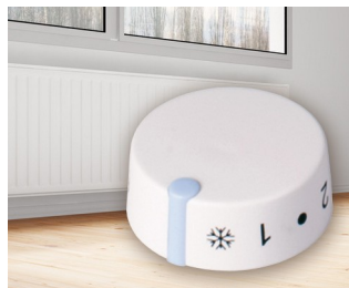
Integrated thermostat for electric storage heaters