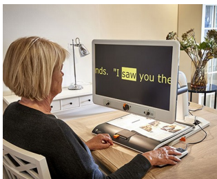
Control knobs for video magnifier