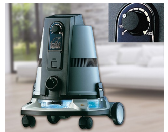
Operating element for a vacuum cleaner