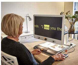
Control knobs for video magnifier