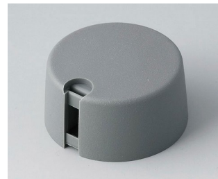
A1031638 TOP-KNOBS 31 PA 6 volcano 31x16mm 1/4"