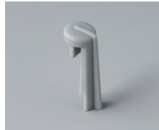
A1105007 Arrow PA 6 (UL 94 HB) mineral