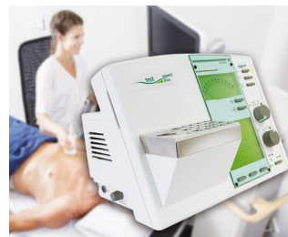
Operating element for a diagnostic device