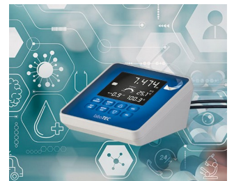
Laboratory measuring device