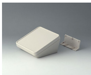
B4414207 PROTEC 140, Vers. II ASA+PC (UL 94 V-0) off-white RAL 9002 140x140x76mm IP 65 opt.