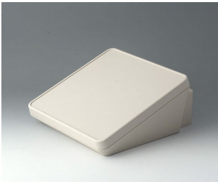
B4422307 PROTEC 220, Vers. III ASA+PC (UL 94 V-0) off-white RAL 9002 220x243x108mm IP 65 opt.