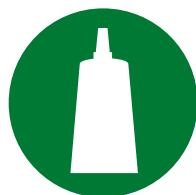
Instalação / Montagem de acessórios