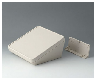
B4418207 PROTEC 180, Vers. II ASA+PC (UL 94 V-0) off-white RAL 9002 180x180x92mm IP 65 opt.