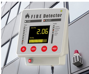
Terminal for fire alarm systems