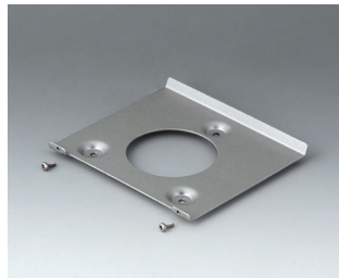
B4518101 Wall suspension element 180 Aluminium