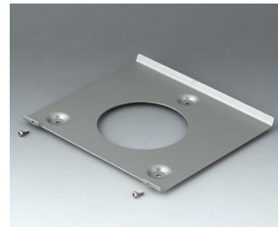
B4522101 Wall suspension element 220 Aluminium