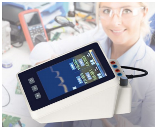
Multimeter measuring device