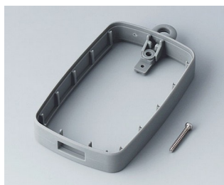
B9004798 Промежуточное кольцо EM, под разъем USB типа A СЭБС (ТПЭ) вулкан