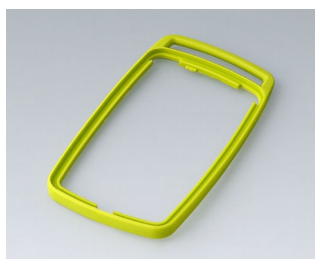
B9006704 Промежуточное кольцо EL СЭБС (ТПЭ) зеленый