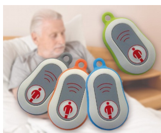
Radio paging systems