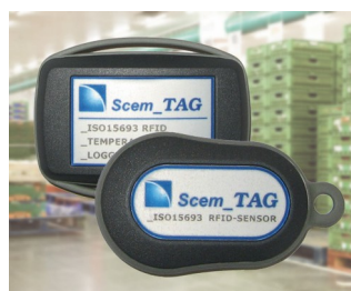
RFID sensor transponder and data logger