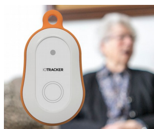
LoRa GPS tracker with alarm button