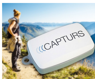
GPS tracking in real time