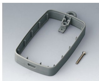
B9004778 Промежуточное кольцо EM, под разъем Micro USB СЭБС (ТПЭ) вулкан