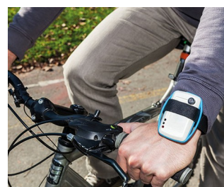
Mobile air quality monitoring