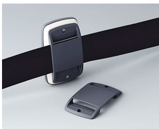
B9106108 Адаптер EL для крепления на ремень АБС (UL 94 HB) лава