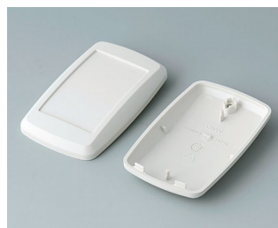
B9004807 Верхняя и нижняя части EM АБС (UL 94 HB) белый RAL 9002 68x42x18mm