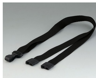
B9100073 Ремешок для ношения черный 914x16mm