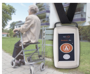
Radio transmitter for emergency call system for patients