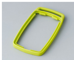
B9002704 Промежуточное кольцо ES ТРЕ зеленый