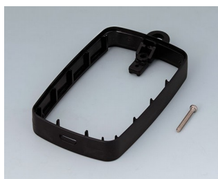
B9004776 Промежуточное кольцо EM, под разъем Micro USB ПММА (ИК) (UL 94 HB) черный RAL 9005