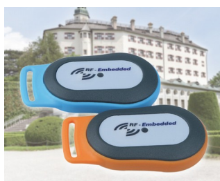
Mobile RFID information system