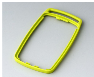
B9004704 Промежуточное кольцо EM ТРЕ зеленый