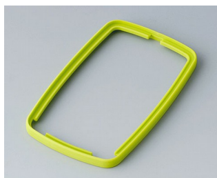
B9006784 Промежуточное кольцо EL СЭБС (ТПЭ) зеленый