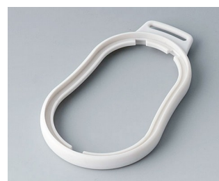
B9006307 Промежуточное кольцо DL СЭБС (ТПЭ) белый RAL 9002