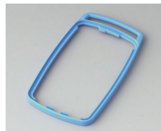
B9004705 Промежуточное кольцо EM ТРЕ синий