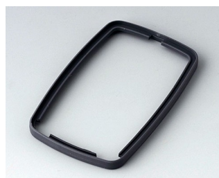
B9006782 Промежуточное кольцо EL СЭБС (ТПЭ) лава