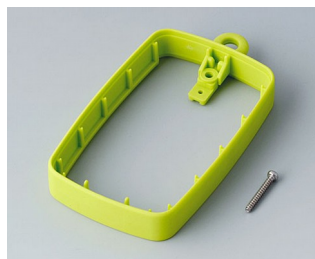
B9004784 Промежуточное кольцо EM, высокое СЭБС (ТПЭ) зеленый