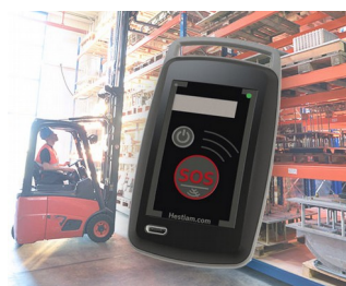
Mobile Security Solutions for workers