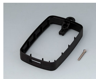
B9004796 Промежуточное кольцо EM, под разъем USB типа A ПММА (ИК) (UL 94 HB) черный RAL 9005