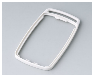
B9004707 Промежуточное кольцо EM ТРЕ белый RAL 9002