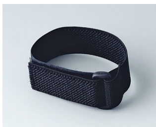
B9100033 Назаястный ремешок черный 280mm