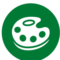
Отливка из нестандартных материалов