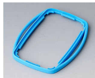
B9004755 Промежуточное кольцо EM ТРЕ синий