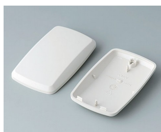
B9004857 Верхняя и нижняя части EM АБС (UL 94 HB) белый RAL 9002 68x42x18mm