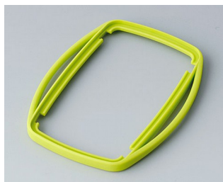
B9006754 Промежуточное кольцо EL СЭБС (ТПЭ) зеленый