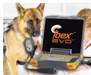
Portable ultrasonic device for veterinary medicine