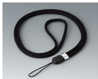
B9100063 Ремешок для ношения черный 860mm