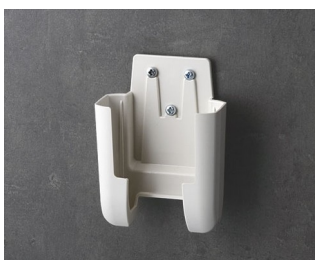
A9105627 Настенный держатель S ACA+ПК (UL 94 V-0) белый RAL 9002