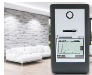
Spectral light meter