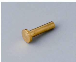
A9193030 Контактная площадка позолоченный