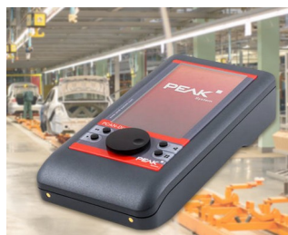
Mobile diagnostic device for CAN and CAN FD buses