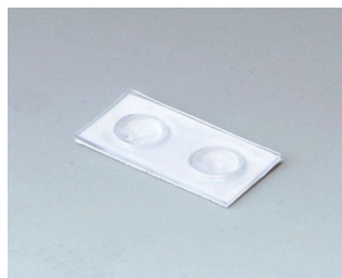
A9207150 Резиновые ножки 6,5 x 2 мм прозрачный

Возможно внесение изменений без предварительного уведомления. © by OKW Gehäusesysteme, Buchen/Germany.