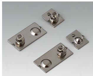
A9190024 Набор батарейных контактов, 3 x AAA Сталь никелированный