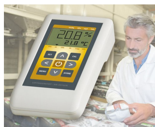
Газоанализатор кислорода в воздухе