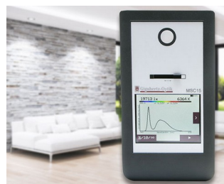
Spectral light meter