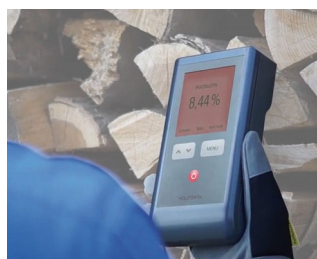
Wood moisture measuring device