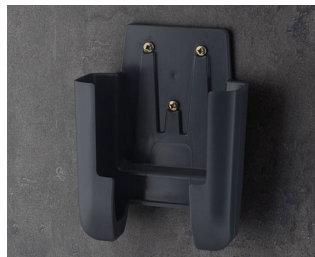
A9107628 Настенный держатель L АСА+ПК (UL 94 V-0) лава