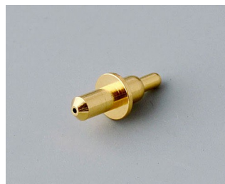
A9193031 Пружинный контакт позолоченный