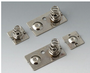
A9190023 Набор батарейных контактов, 3 x AA Сталь никелированный