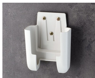
A9106627 Настенный держатель M ACA+ПК (UL 94 V-0) белый RAL 9002