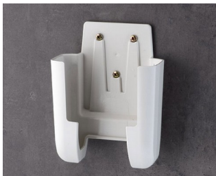
A9107627 Настенный держатель L АСА+ПК (UL 94 V-0) белый RAL 9002