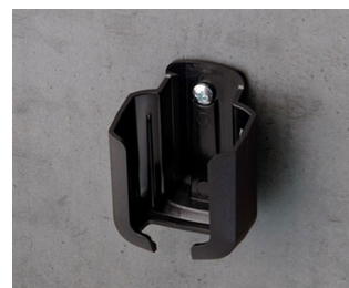
B2921509 Настенный держатель S ACA+ПК (UL 94 V-0) черный RAL 9005