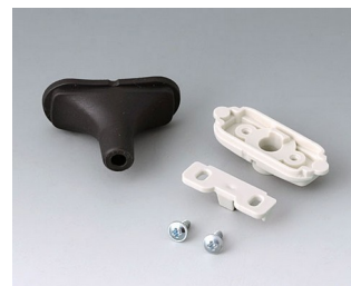
B2911329 Набор для ввода кабеля, 5,0 - 5,9 TPE черный RAL 9005