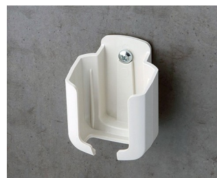
B2921507 Настенный держатель S ACA+ПК (UL 94 V-0) белый RAL 9002