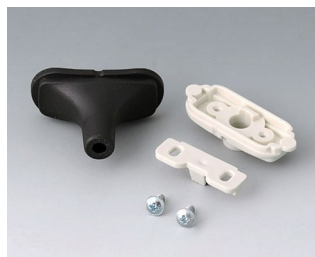
B2911319 Набор для ввода кабеля, 4,2 - 5,0 TPE черный RAL 9005