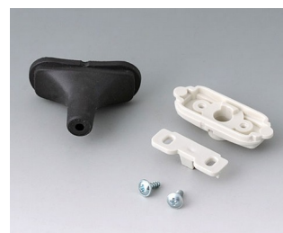
B2911309 Набор для ввода кабеля, 3,4 - 4,2 TPE черный RAL 9005