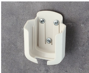
B2931507 Настенный держатель М АСА+ПК (UL 94 V-0) белый RAL 9002