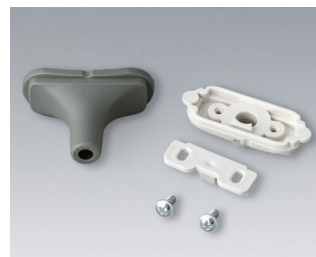
B2911328 Набор для ввода кабеля, 5,0 - 5,9 TPE вулкан