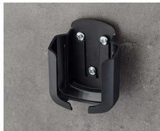
B2931509 Настенный держатель М АСА+ПК (UL 94 V-0) черный RAL 9005