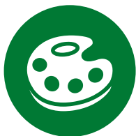
Отливка из нестандартных материалов