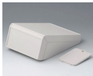
B4056227 UNITEC M, 1,4/0,6 АБС (UL 94 HB) белый RAL 9002 148x210x80mm IP 40