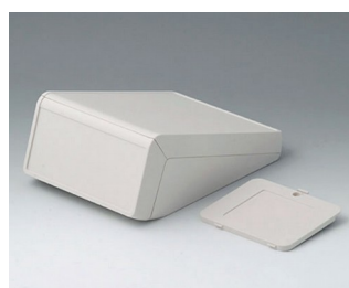
B4056327 UNITEC M, 1,4/0,6 АБС (UL 94 HB) белый RAL 9002 148x210x80mm IP 40