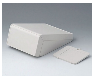
B4056307 UNITEC M, 0,6/0,6 АБС (UL 94 HB) белый RAL 9002 148x210x80mm IP 40