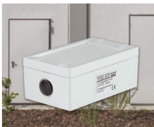
Electromechanical door locking device