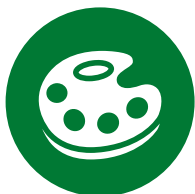
Отливка из нестандартных материалов