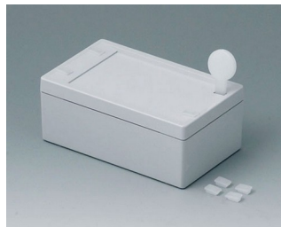
C3006101 SNAPTEC 60 x 100 АБС (UL 94 HB) светло-серый RAL 7035 60x100x40mm IP 65