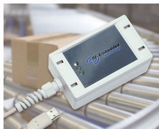
Robust UHF reader