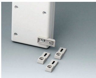
A9204108 Ушки для настенного монтажа ПА 6 тепло-серый RAL 7032