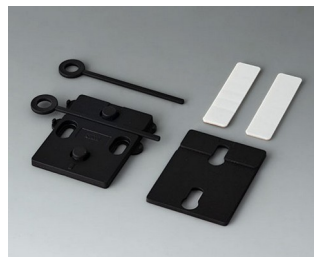
A9305019 Настенный держатель АСА+ПК (UL 94 V-0) черный RAL 9005