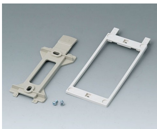
B1360048 Набор для настенного монтажа АБС (UL 94 HB) тепло-серый RAL 7032