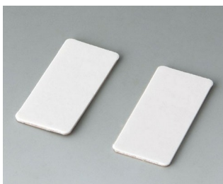
A9305147 Двусторонний скотч (2 полоски)

Возможно внесение изменений без предварительного уведомления. © by OKW Gehäusesysteme, Buchen/Germany.