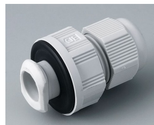
C2316717 Кабельный ввод для быстрой установки, M16 ПА светло-серый RAL 7035 IP 68