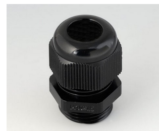
C2320419 Кабельный ввод M20 x 1,5 ПА черный RAL 9005