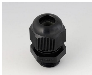
C2316419 Кабельный ввод M16 x 1,5 ПА черный RAL 9005 IP 68