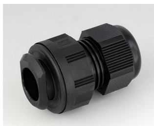
C2320719 Кабельный ввод для быстрой установки, M20 ПА черный RAL 9005