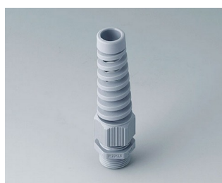
C2320518 Кабельный ввод M20 x 1,5, с защитой от изгиба ПА серебристо-серый RAL 7001