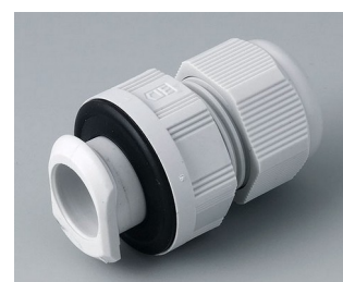
C2320717 Кабельный ввод для быстрой установки, M20 ПА светло-серый RAL 7035