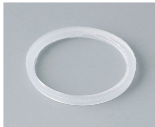
C2320126 Уплотнительное кольцо для кабельного ввода M20 ПЭ естественная окраска

Возможно внесение изменений без предварительного уведомления. © by OKW Gehäusesysteme, Buchen/Germany.