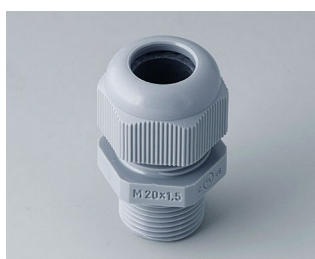
C2320428 Кабельный ввод M20 x 1,5 ПА серебристо-серый RAL 7001