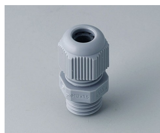
C2312418 Кабельный ввод M12 x 1,5 ПА серебристо-серый RAL 7001 IP 68