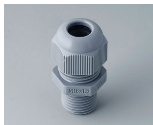
C2316618 Кабельный ввод M16 x 1,5 ПА серебристо-серый RAL 7001 IP 68