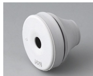
C2320137 Кабельная манжета EPDM светло-серый RAL 7035 IP 67