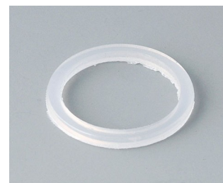
C2316126 Уплотнительное кольцо для кабельного ввода M16 ПЭ естественная окраска