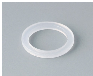
C2312126 Уплотнительное кольцо для кабельного ввода M12 ПЭ естественная окраска