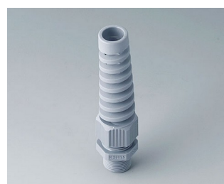
C2320528 Кабельный ввод M20 x 1,5, с защитой от изгиба ПА серебристо-серый RAL 7001