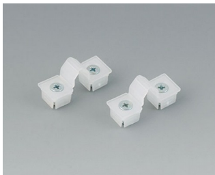
C2299031 Внутренние петли ПП естественная окраска