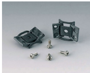
C8100360 Набор петель