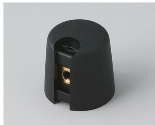
A1016049 Ручка TOP-KNOB 16 ПА 6 nero 16x16mm 4mm