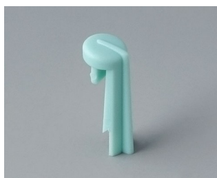
A1105005 Указатель «стрелка» ПА 6 (UL 94 HB) лагуна