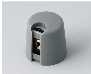
A1016048 Ручка TOP-KNOB 16 ПА 6 вулкан 16x16mm 4mm