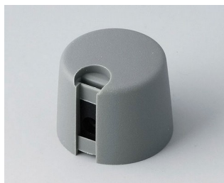
A1020648 Ручка TOP-KNOB 20 ПА 6 вулкан 20x16mm