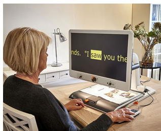
Control knobs for video magnifier