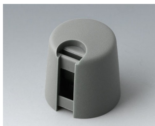
A1016648 Ручка TOP-KNOB 16 ПА 6 вулкан 16x16mm