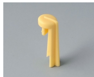
A1105004 Указатель «стрелка» ПА 6 (UL 94 HB) пляж