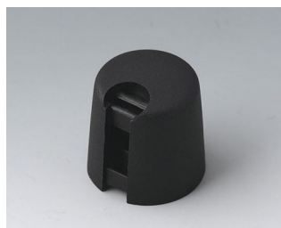
A1016649 Ручка TOP-KNOB 16 ПА 6 nero 16x16mm