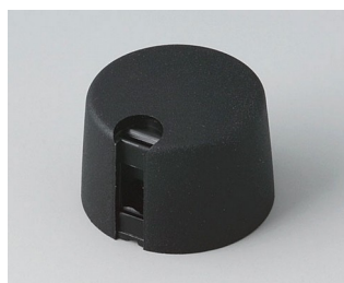
A1024649 Ручка TOP-KNOB 24 ПА 6 nero 24x16mm