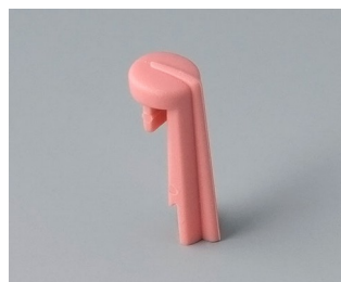
A1105003 Указатель «стрелка» ПА 6 (UL 94 HB) коралл