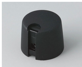
A1020649 Ручка TOP-KNOB 20 ПА 6 nero 20x16mm