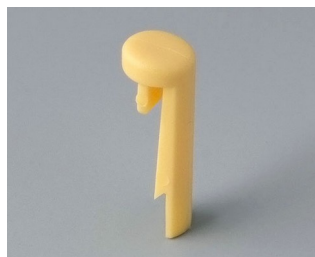
A1101004 Указатель «простой» ПА 6 (UL 94 HB) пляж