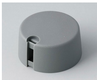
A1031648 Ручка TOP-KNOB 31 ПА 6 вулкан 31x16mm