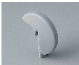
A1103007 Указатель «диск» ПА 6 (UL 94 HB) минерал