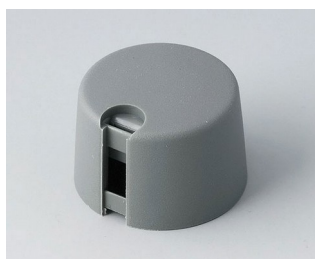
A1024648 Ручка TOP-KNOB 24 ПА 6 вулкан 24x16mm