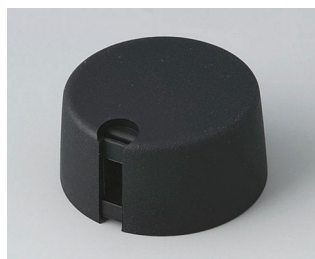
A1031649 Ручка TOP-KNOB 31 ПА 6 nero 31x16mm