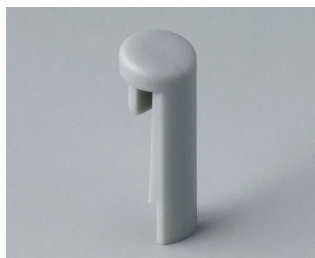
A1101007 Указатель «простой» ПА 6 (UL 94 HB) минерал