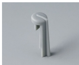
A1105007 Указатель «стрелка» ПА 6 (UL 94 HB) минерал