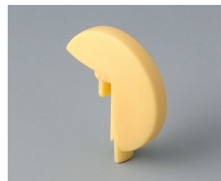
A1103004 Указатель «диск» ПА 6 (UL 94 HB) пляж