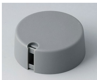
A1040648 Ручка TOP-KNOB 40 ПА 6 вулкан 40x16mm