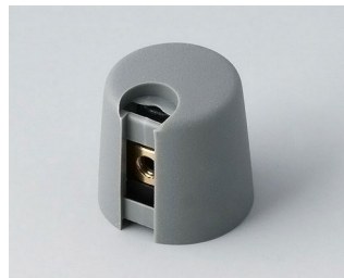
A1016068 Ручка TOP-KNOB 16 ПА 6 вулкан 16x16mm 6mm