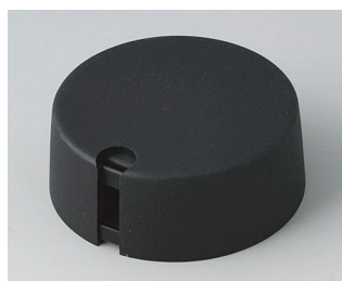
A1040649 Ручка TOP-KNOB 40 ПА 6 nero 40x16mm