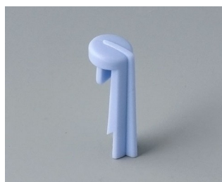
A1105006 Указатель «стрелка» ПА 6 (UL 94 HB) небо