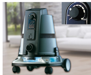
Operating element for a vacuum cleaner