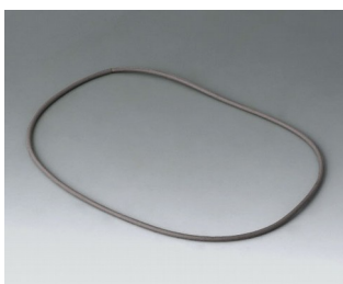
B4514030 Уплотнительная прокладка 140