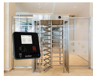
Terminal for access control