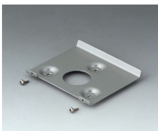
B4514101 Настенный держатель 140 Алюминий