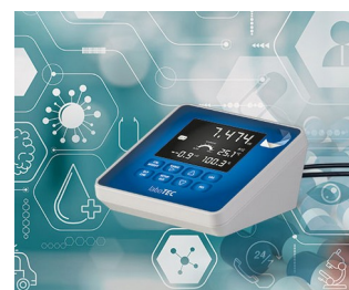
Laboratory measuring device